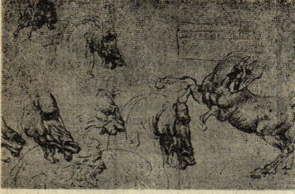
Lernardo Da Vinci - Eskiz